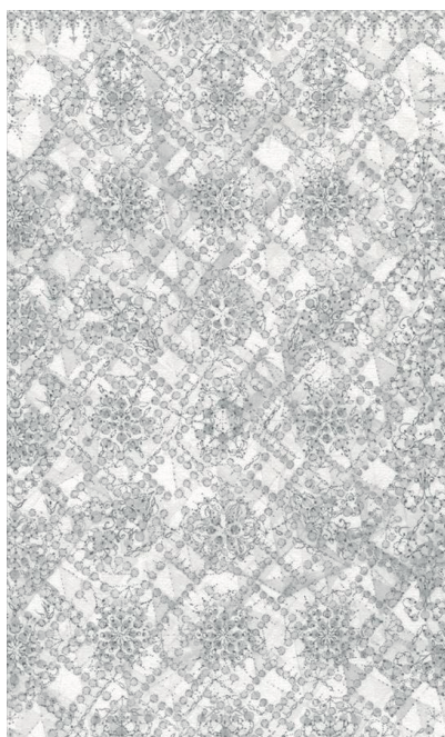
勢藤明紗子 N°054 (detail) 2022 コットンペーパー・青墨、ドローイング 210x210mm http://ask-set.com/