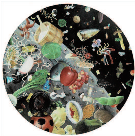
岡田よしたか / OKADA Yoshitaka