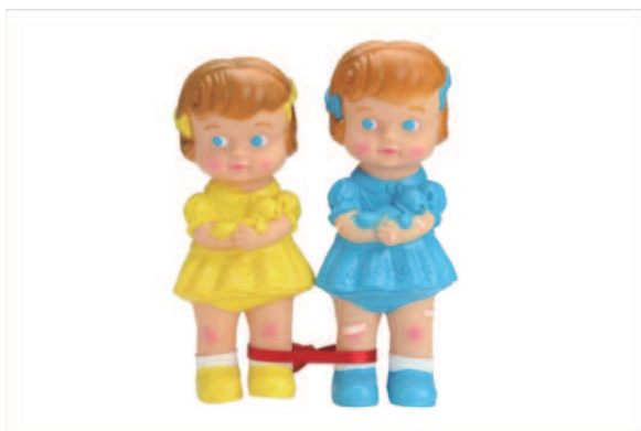
「人に合わせるの得意じゃないっぽい」 2018 ラバードール、絆創膏デカール、リボン

なにげない毎日。 ふと思ったことを書きためる。 大事なこと、どうでもいいこと、いろんなこと。 思ったことひとつひとつにはなにか意味がある気がする。 はっきり知りたいわけじゃないけどかたちにして残したくなった。