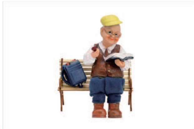
「結構長く使ってる物多い」 2018