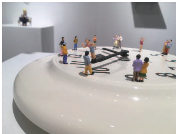
個展「ぬいぐるみ、と、あさ、グレープフルーツ、に、やわらかい、ひっこし」 展示風景 (2018)