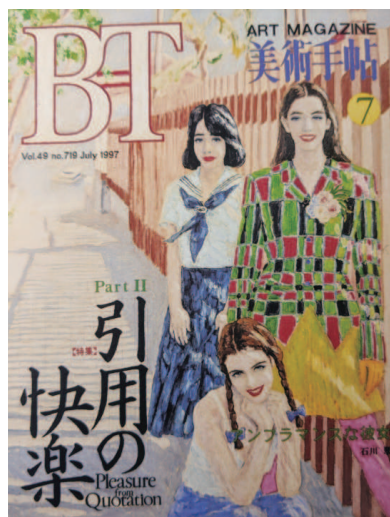
「BT」 1996 キャンバスに油彩 1167×909 mm