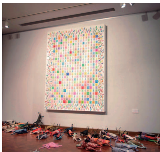
「ファティアによる バッタもんのウソ八百 No. 1」 2012年 2110×1623×155 mm ミクストメディア * 「バッタもんのバッタもん」展 ギャラリーアーティストロングで の展示風景、2011年