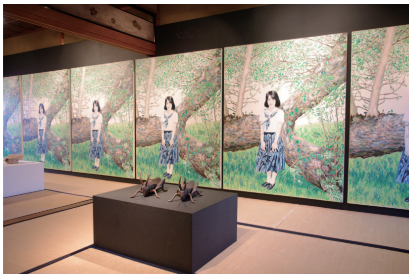
「青紀」 1990-1992 キャンバスに油彩 1621×1303 mm each *ボーダレスアートミュージアム NO-MA での展示風景、2013年