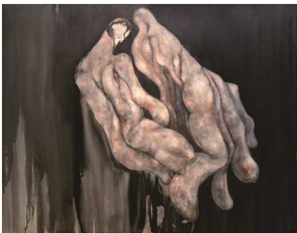
情の確認 2018 キャンバスに油彩、墨汁 /1167×910mm

私はその生きていくうえで避けることのできない選択と同じように、 多く選択を重ね続けた作品から「何か」を見出し、 その影響によりまた新たな選択を繰り返す。