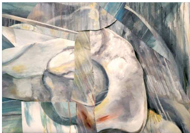
rebirth No.1 2018 キャンバスに油彩 /652×500mm