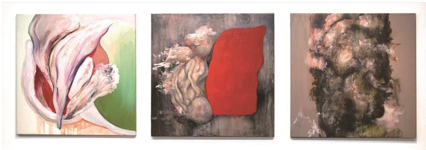
種 No1-No.3 2019 キャンバスに油彩、アキーラ 各 606×606mm