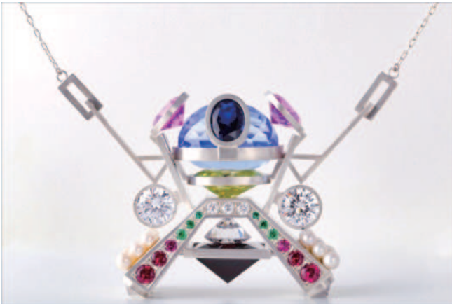
Point_obj 2016年 材料：silver950, synthetic stones, pearl, topaz