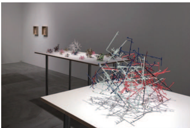
Venice Project 2017 の展示イベント風景 2017年