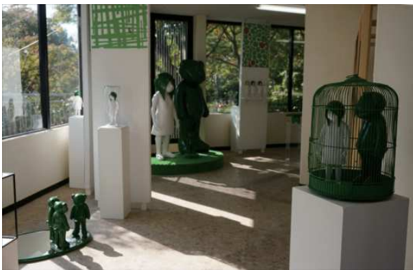
ポータルス・エリア近江八幡芸術祭『ちかくのたび』 近江八幡市街6会場（八幡山展望館） 2019年

コロナウイルスの残香漂う平安の京都を介し、KUNSTARZTの空間がミニマムな宇宙となれば…。