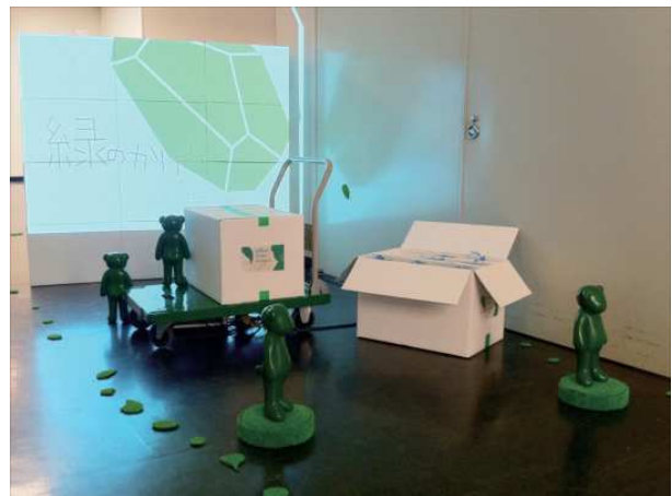
C A F・Nびわこ展 『Green chan Project 2017 - 緑のかけらを探して - 』 大津市歴史博物館