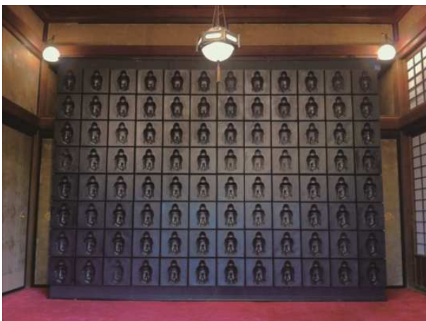
BIWAKO ビエンナーレ 2018 『微笑みの壁 4×9 8×9』 近江八幡市旧市街（八幡山瑞龍寺）