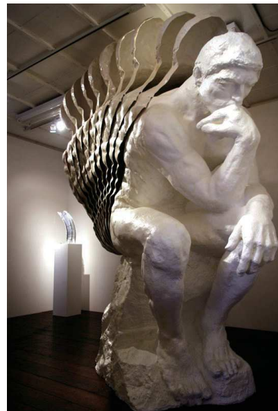
Stacking His Backs 2013