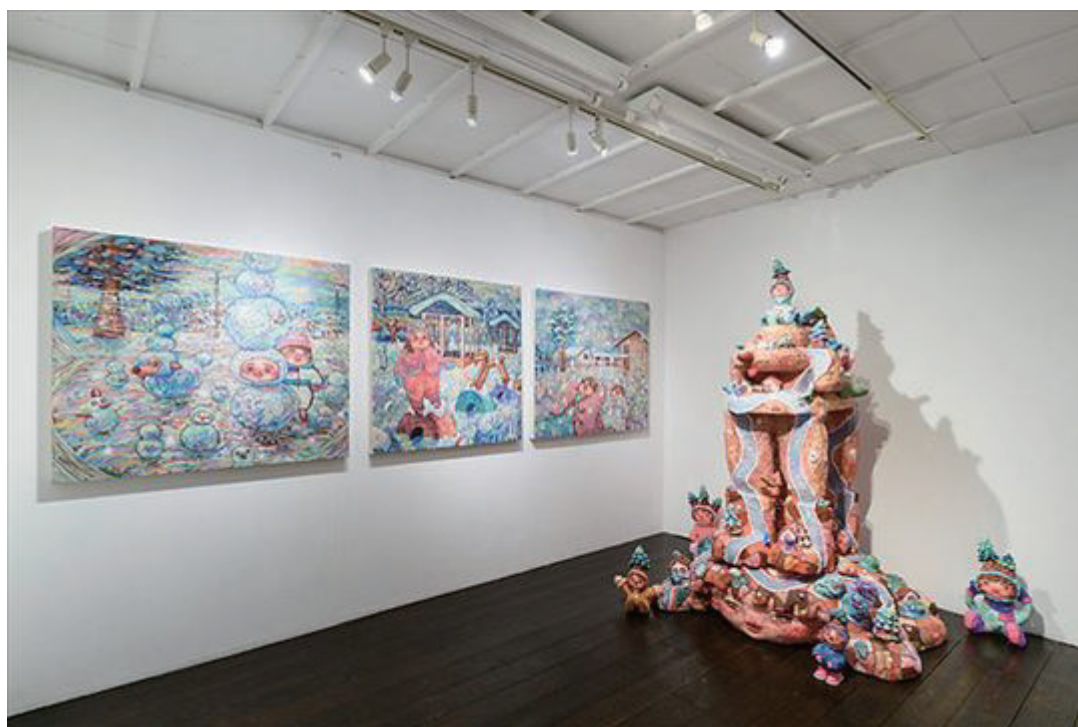
個展「昼下がりの町」(2022) 展示風景