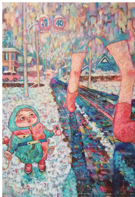
まがりくねった道 2022 キャンバスにアクリル絵具